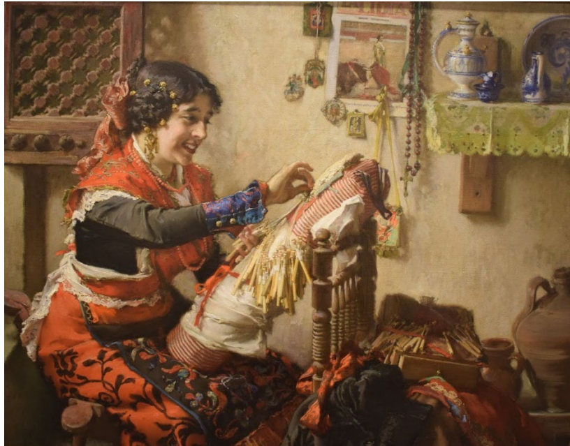
Francisco Pradilla. Para mi boda...! Encajera de bolillos , 1915. Colección Pedrera Martínez, Orihuela (Alicante)

arte ayudaron a engrandecer nuestra fiesta. De esta manera, Pradilla, la muchacha encajera, Joselito, La Lidia... siguen vivos.